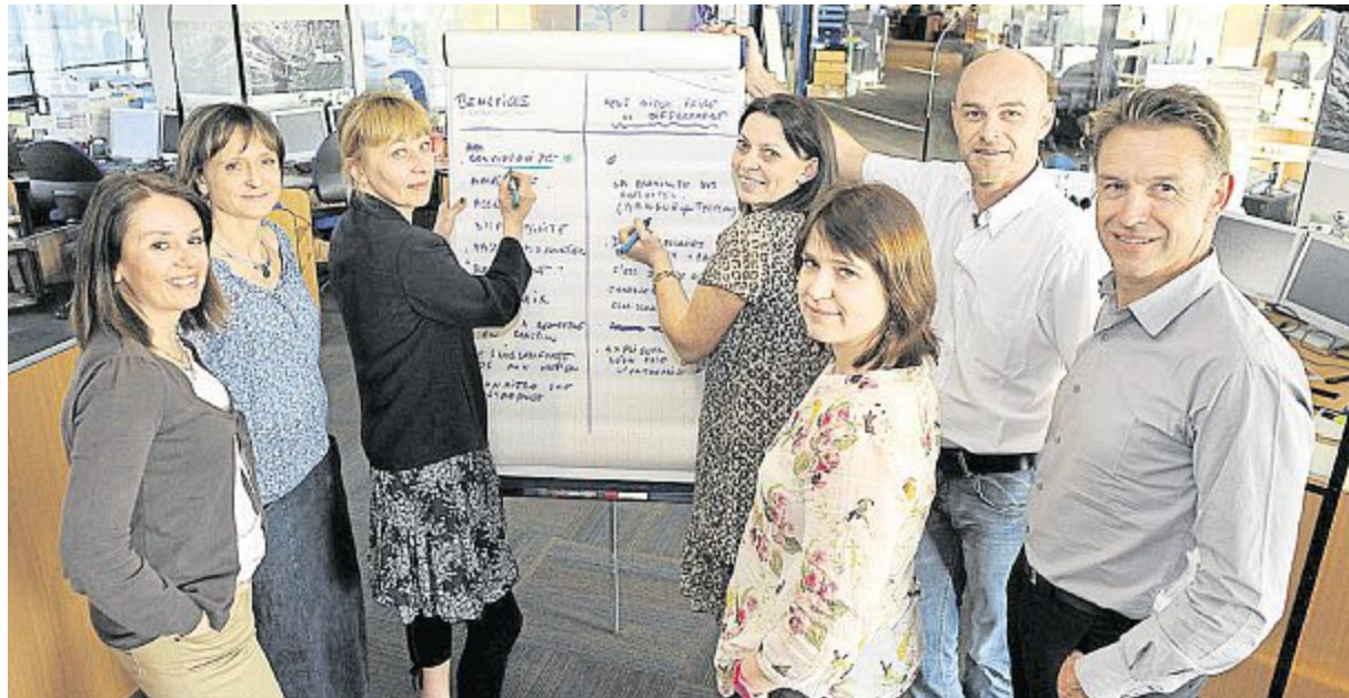
Hier soir, les managers se sont regroupés au siège de la Banque populaire de l'Ouest, à Montgermont, pour débriefer sur leurs expériences éphémères mais intenses.

Chacun se présente. Raconte son expérience. Ce qui l'a étonné. Ce qu'il en retire. Les collaborateurs d'Orange sont surpris par la gestion des grilles horaires de la BPO. Ceux d'Orange sont médusés par l'absence de bureaux fermés à la BPO pour les superviseurs... Sourires de complicité.